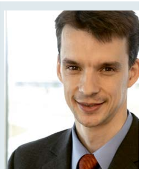
Der Autor berät deutschlandweit zu allen Rechtsfragen rund um die Solarenergie.

Eine bessere Alternative zum Gerichtsverfahren kann sein, den Streit außergerichtlich zu entscheiden. Möglich ist, dass sich beide Parteien auf einen Sachverständigen einigen, der die Photovoltaikan-